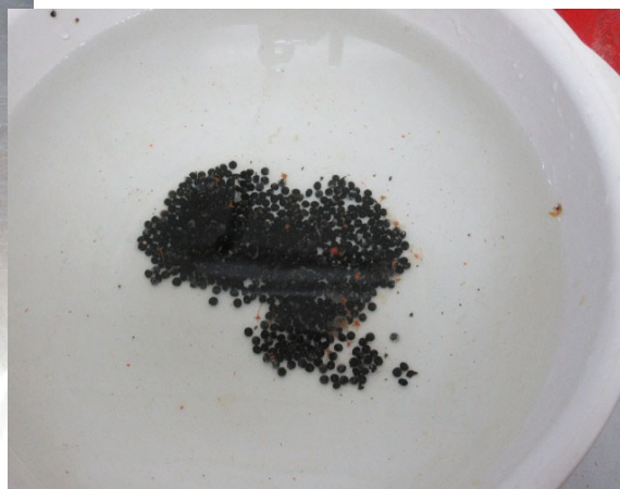
種子の雑皮分離作業