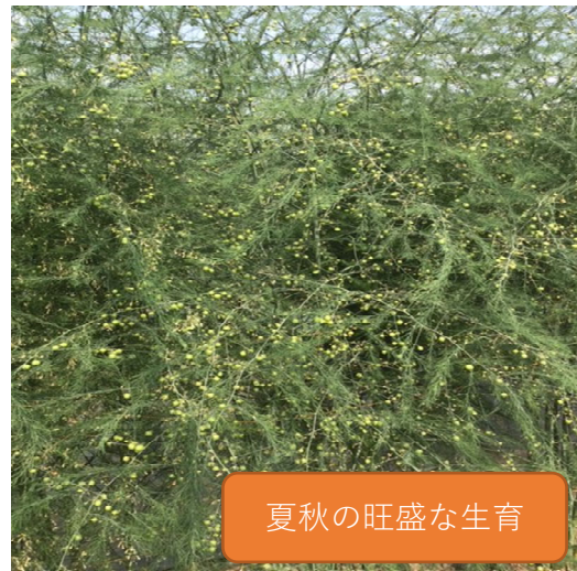
夏秋の旺盛な生育