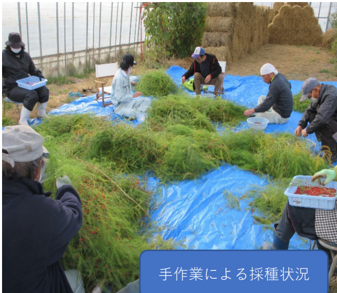
手作業による採種状況