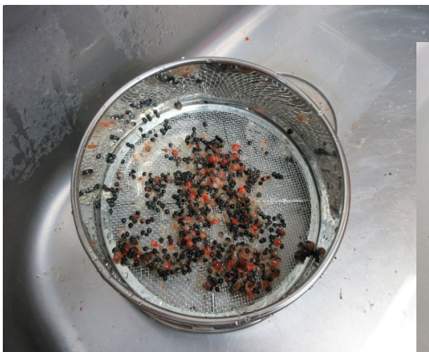
採取後の表皮水洗選別