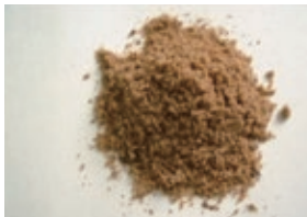
ミートボーンミール